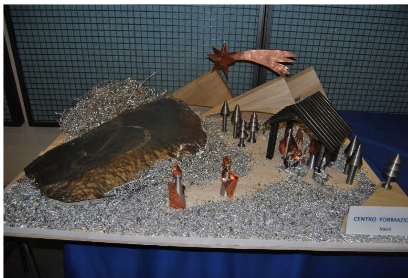
Presepe Mostra artigiani - Camera di Commercio 2017 - 2018